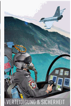
VERTEIDIGUNG &amp; SICHERHEIT

Wir sind eine eng vernetzte Unternehmensgruppe und bieten integrierte zukunftsorientierte Lösungen in den Branchen Automotive • InfoKom • Mobilität, Energie & Umwelt • Luftfahrt • Raumfahrt • Verteidigung & Sicherheit. Wir verstehen die Anforderungen unserer Kunden. Wir beraten unabhängig und kompetent. Wir realisieren effektiv, effizient und zielgerichtet. Wir betreiben zuverlässig und nachhaltig. Unsere internationale Marktpräsenz und unser Erfolg basieren auf technologischer Spitzenkompetenz und einem fairen Verhältnis zu unseren Kunden und Geschäftspartnern.