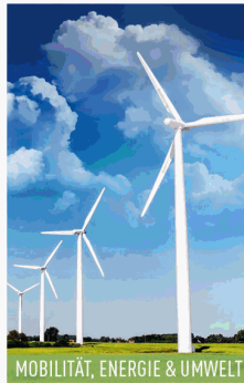
MOBILITÄT, ENERGIE &amp; UMWELT